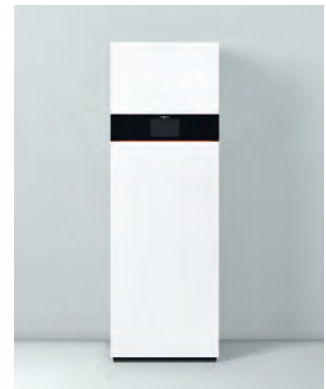
Vitodens 343-F (Typ B3UG)

Warmwasser-Ausgangsleistung bei Trinkwassererwärmung von 10 auf 45 °C.