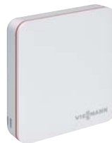
ViCare Thermostat für mehr Komfort und Effizienz

Voraussetzung unter www.viessmann.de/garantie