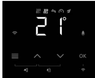
LCD-Display mit 7-Segment-Anzeige und Touch-Buttons